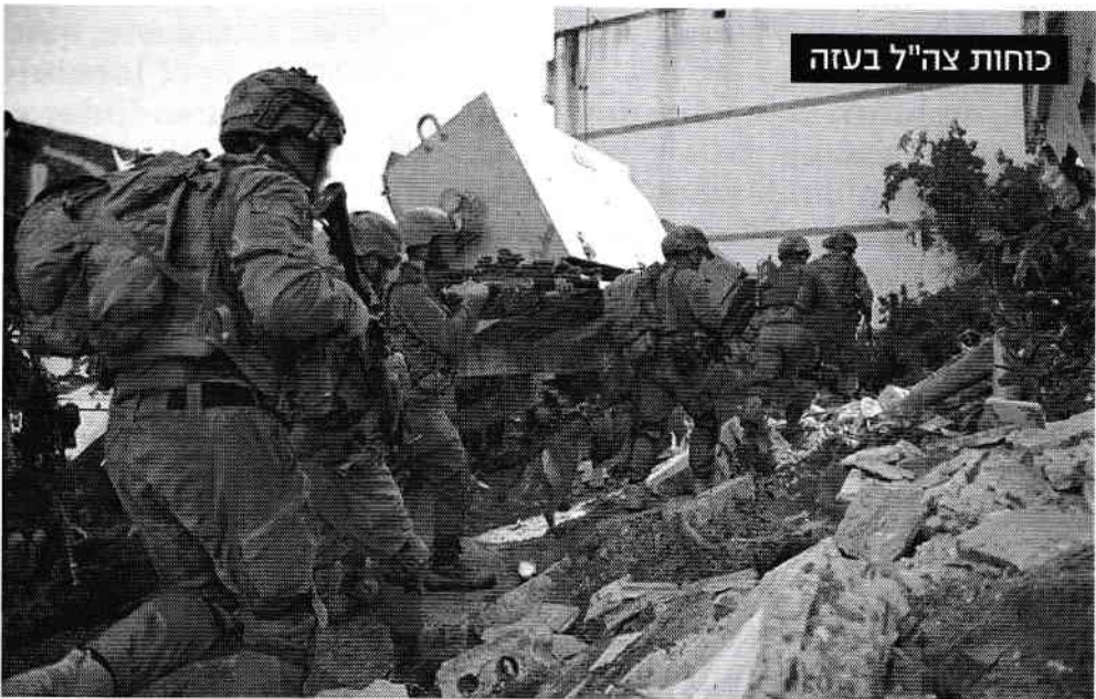
Forțele Tzahal în acțiune